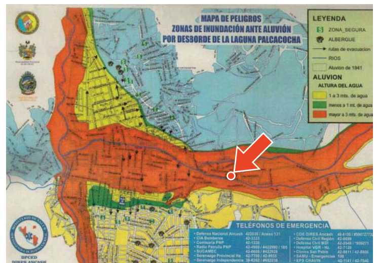
Die Gefährdungskarte zeigt orange unterlegt die Stadtbereiche von Huaraz, die besonders von Hochwasser und einer Flut aus dem Gletschersee Palcacocha bedroht sind (der Pfeil in der Stadtmitte markiert die Lage des Wohnhauses der Familie Luciano Lliuya).