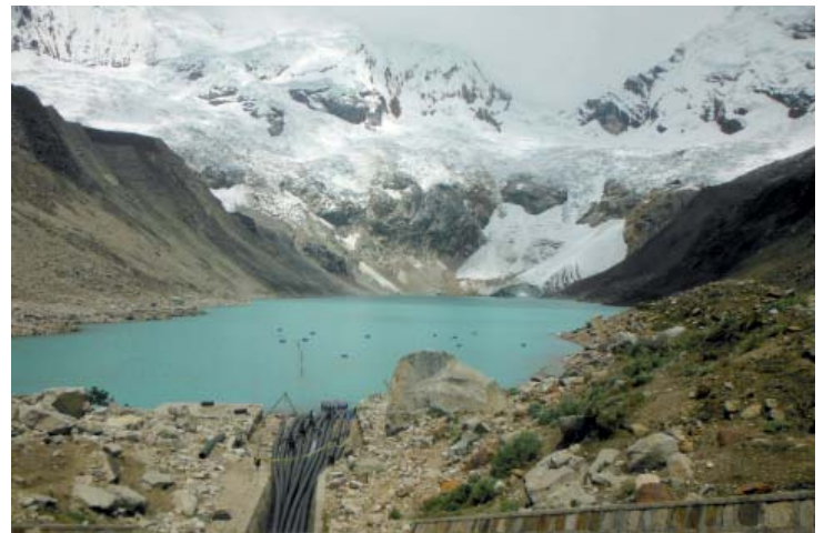
Der Gletschersee Palcacocha mit einem provisorischen Abpumpsystem im Vordergrund, das nicht ausreichend ist, um eine gefährliche Flutwelle zu vermeiden.