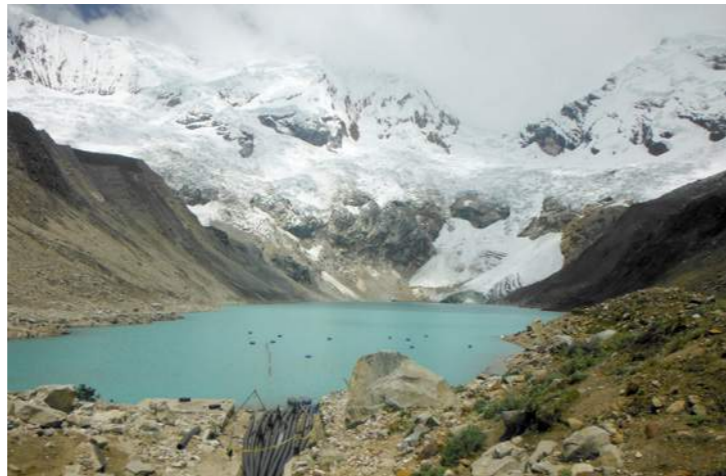
Der Gletschersee Palcacocha mit einem provisorischen Abpumpsystem im Vordergrund, das nicht ausreichend ist, um eine gefährliche Flutwelle zu vermeiden.