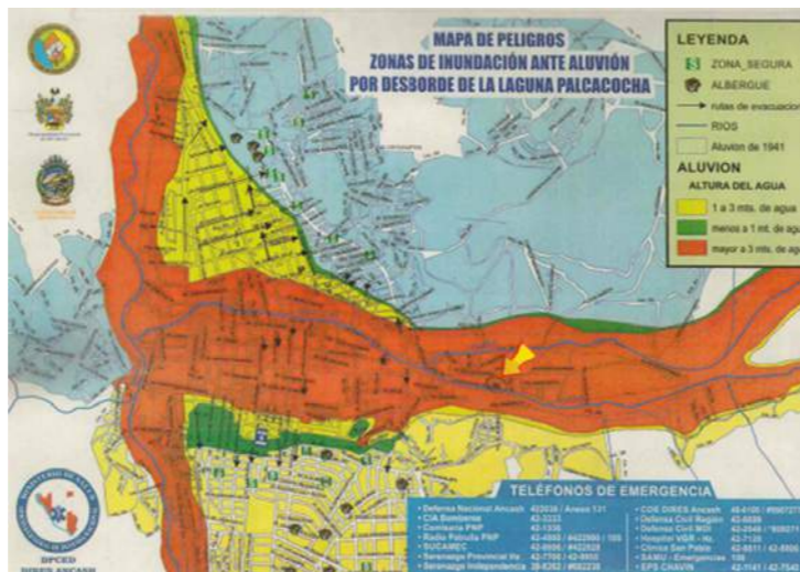
Die Gefährdungskarte zeigt orange unterlegt die Stadtbereiche von Huaraz, die besonders von Hochwasser und einer Flut aus dem Gletschersee Palcacocha bedroht sind (der Pfeil in der Stadtmitte markiert die Lage des Wohnhauses der Familie Luciano Lliuya).